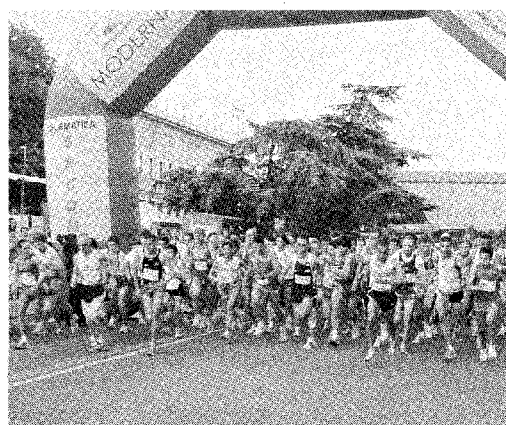
La partenza della Quattro Porte, edizione 2007